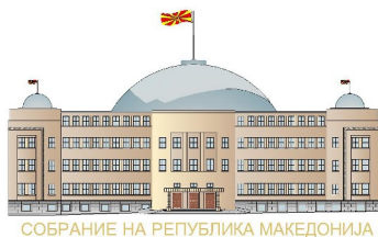
СОБРАНИЕ НА РЕПУБЛИКА МАКЕДОНИЈА